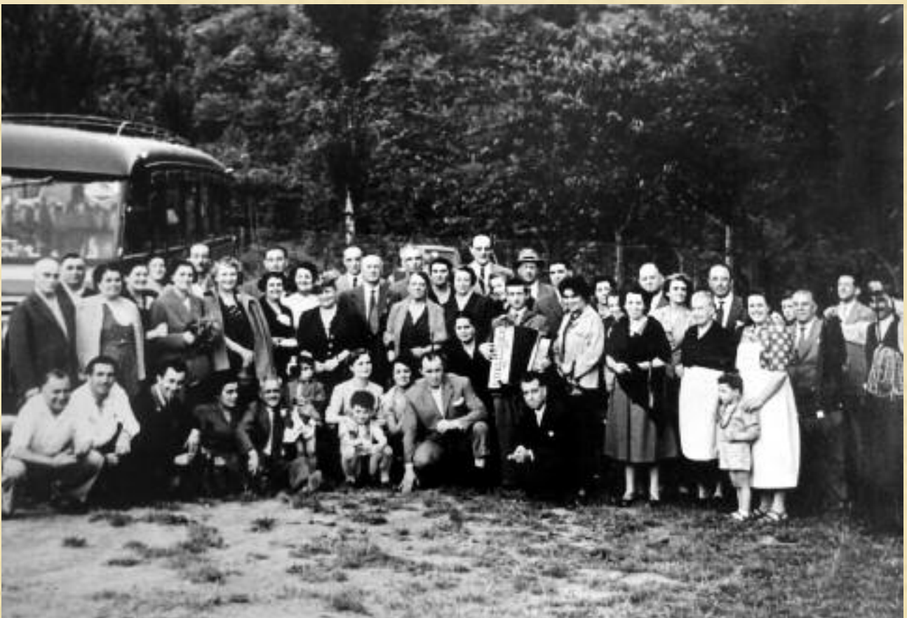
Gita sociale A Compagna al Santuario della Vittoria 15 maggio 1939, da notare la corriera d'epoca con cofano motore anteriore lungo e gonfalone dietro a tutti che però si vede poco perché parzialmente arrotolato forse dal vento.