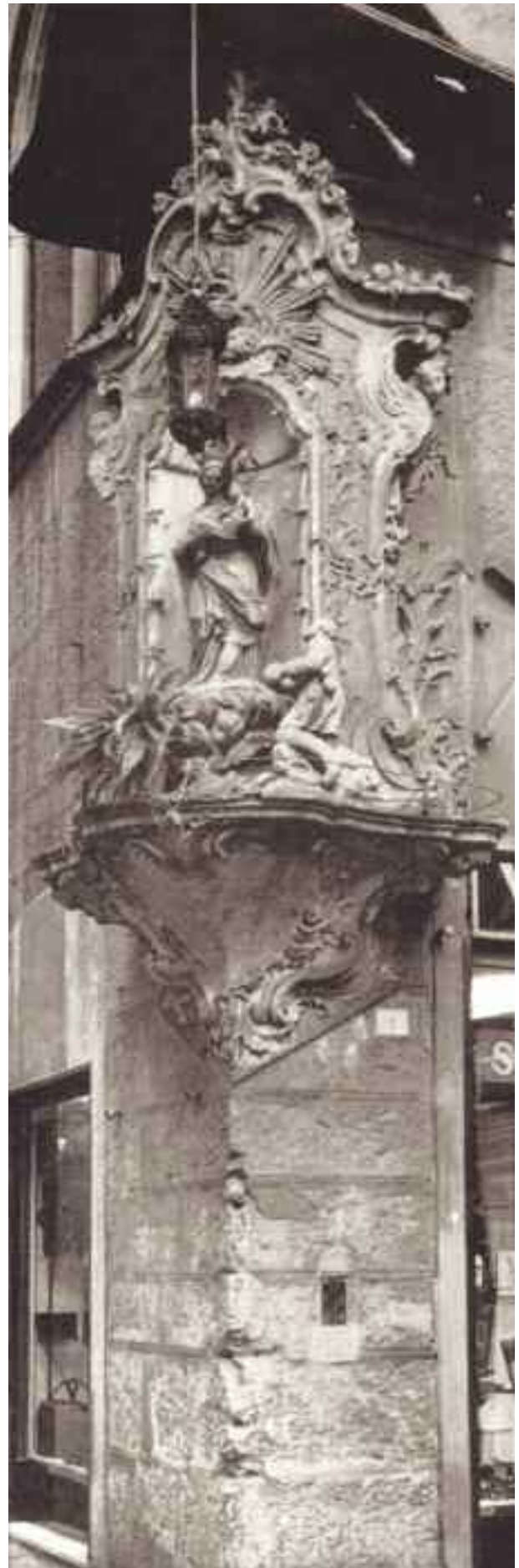
Edicola dedicata alla Madonna della Guardia. Genova via san Pietro della Porta.