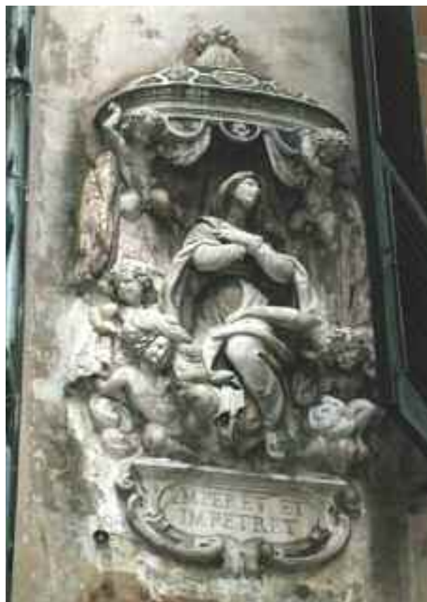
Sopra: Madonna con Angeli. Genova, via di Scurreria.