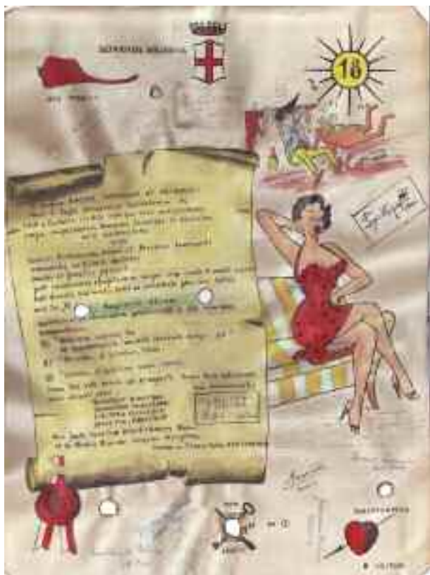
Sopra: un tradizionale “papiro”