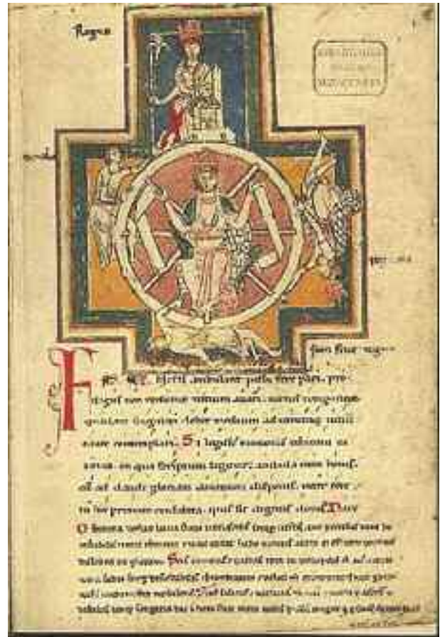
Sopra: una pagina del codice Carmina Burana.

Son coscì di quei tempi, i primmi goliardi e i Carmina Burana, silloge poetica (musicâ poi da Carl Orff into 1937); e ascì pöco a pöco e regole dêtæ da o Dûxe pe i studenti: o beretto a punta de tanti colori a segunda da mateia de studio e, da nuddo feltro, a êse aredou de ciumma e prede; a gerarchia con i diritti de l’ançianitæ; maxima libertæ, armêno o primmo giorno d’iniçio anno; e canti - in latin o volgare - tutti ineggianti ‘na vitta de ipotetica sfrenâ libertæ - con a triade profanna ma atretanto eterea de “Bacco, tabacco e Venere” e con a poscibilitæ de satirezâ e befezâ pubblicamente tutte e autoritæ - specie quelle