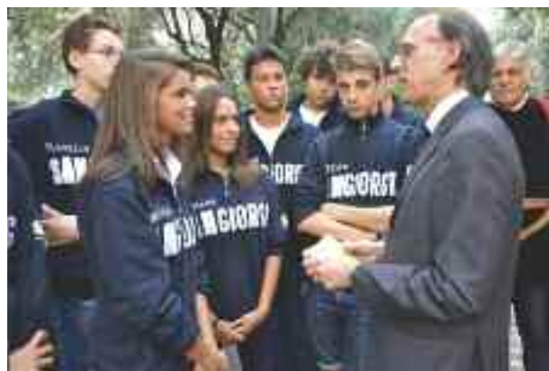
Gli alunni dell’Istituto Nautico San Giorgio alla cerimonia