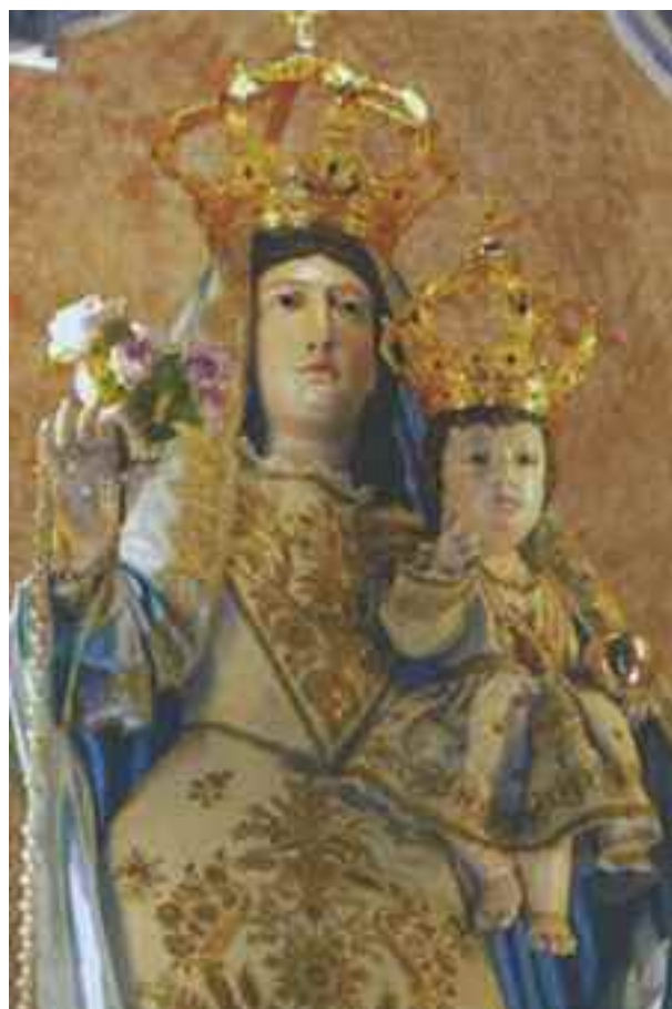
Sotto: Nostra Signora della Fortuna. Genova, chiesa di San Carlo in via Balbi.