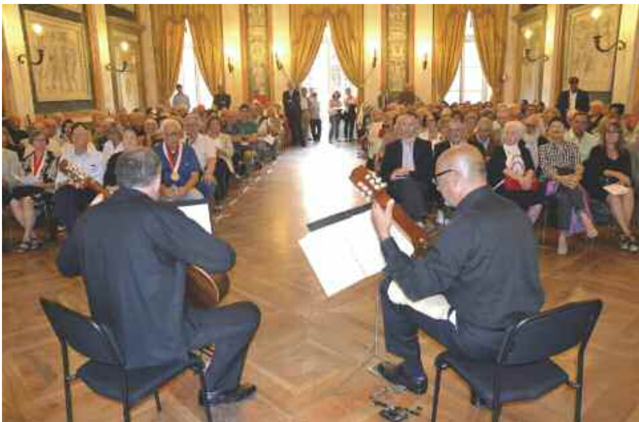
La sala gremita del concerto “Chitarre di Genova”

sfoggiavano una divisa d’ordinanza; un bel colpo d’occhio sono ragazzi molto ben guidati, ne siamo lieti.