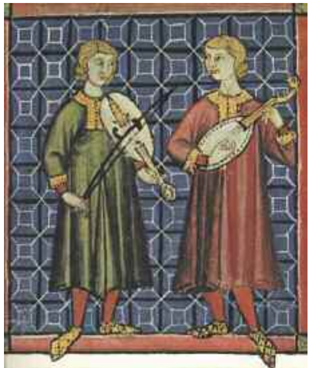
Miniature tratte dalla raccolta delle Cantigas de Santa Maria, canzoni monofoniche spagnole del XIII secolo

Comme ò vosciûo dî into mæ salûo fæto a nomme de tutti i socci da Compagna, o concerto o l'è stæto oferto a-o scindico pe ofrîlo a tutta a neuva aministraçion e quindi a tutto Zena. E o Scindico, ch'o l'è stæto presente fin a-a fin insieme a l'asesò a-a scheua prof. Pino Boê (Boero),