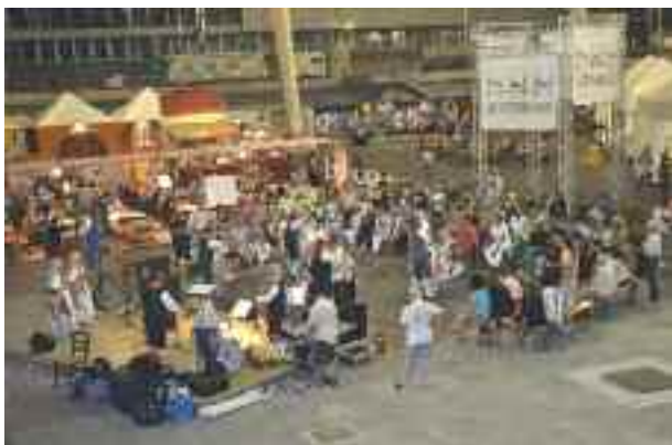
Area Mediterraneo, Gruppo Folklorico Città di Genova

rico Città di Genova il 29 per balli e canti. Una bella intenzione per creare un senso di appartenenza tra paesi che hanno legami con genovesità sparse per il mondo, pensiamo che si potrà ripetere ma, a nostro avviso, con una formula più ordinata.