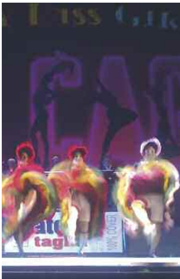
Sotto: Le famose “Girls” del balletto.

clericali e chi c’o fùsse che l’imponèva limiti e fren.