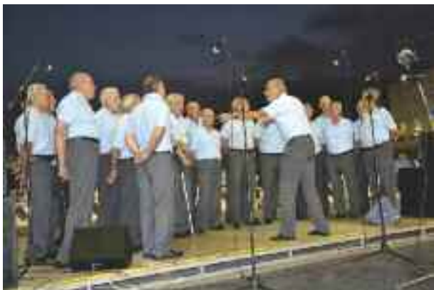
Il Coro Monte Bianco

Poi, ad agosto, la Fiera di Genova ci ha coinvolto in una nuova manifestazione nell'Area Mediterraneo dal nome "Genova Mundi". Abbiamo partecipato a due serate a tema genovese coinvolgendo gli amici: il Coro Monte Bianco il 26 per una serata di canti ed il Gruppo Folclo-