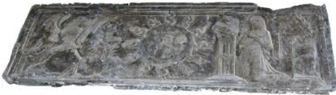
Vico della Croce Bianca, l'Annunciazione di Maria. Bassorilievo in ardesia posto sopra l'ingresso dell'antica locanda.

Genova, città portuale con i suoi intensi traffici commerciali, ha da sempre accolto una moltitudine di viaggiatori, differenti per classe sociale, interessi e nazionalità. In origine erano solo gli ospedali che ospitavano viandanti nel medioevo, poi affiancati dalle locande e dalle stazioni di cambio, in grado di alloggiare carovane di muli in transito. Con lo sviluppo urbanistico della città, fra il XVI e il XVII secolo, l'offerta di ricettività in qualche modo si diversificò.