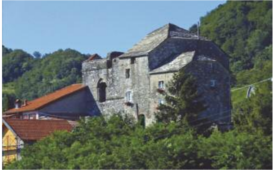
de d'âto: O Pâxo de Tórbi. in mêzo: O grùppo statoâio in sciâ lêza co-i Prioi de Tórbi davanti a l'artâ. de sôtta: l'arîvo da procesción a- a Capélla.

pélla pe sarvâla da-o degrassô. Da alôa, lô organizân 'na fêsta tùtti-i ànni, o doî de zùgno. Pàrtan a pê da-o bivio pe Cà de Brùzzi, vixin a-o Pâxo de Tórbi, e vàn in procesción derê a'n Cristo picin, portôu da unn-a de confratèrnite da valâdda do Porçéivìa. In sciô pròu vixin a-a capélla, o pârego de Tórbi o dîxe a méssa e dôppo, chi veu, o peu mangiâ o menestrón di segagin e âtre cöse.