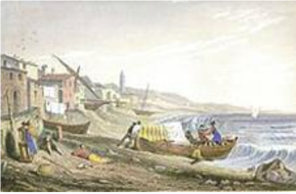
Cogoleto, in una incisione ottocentesca di William Brockedon.