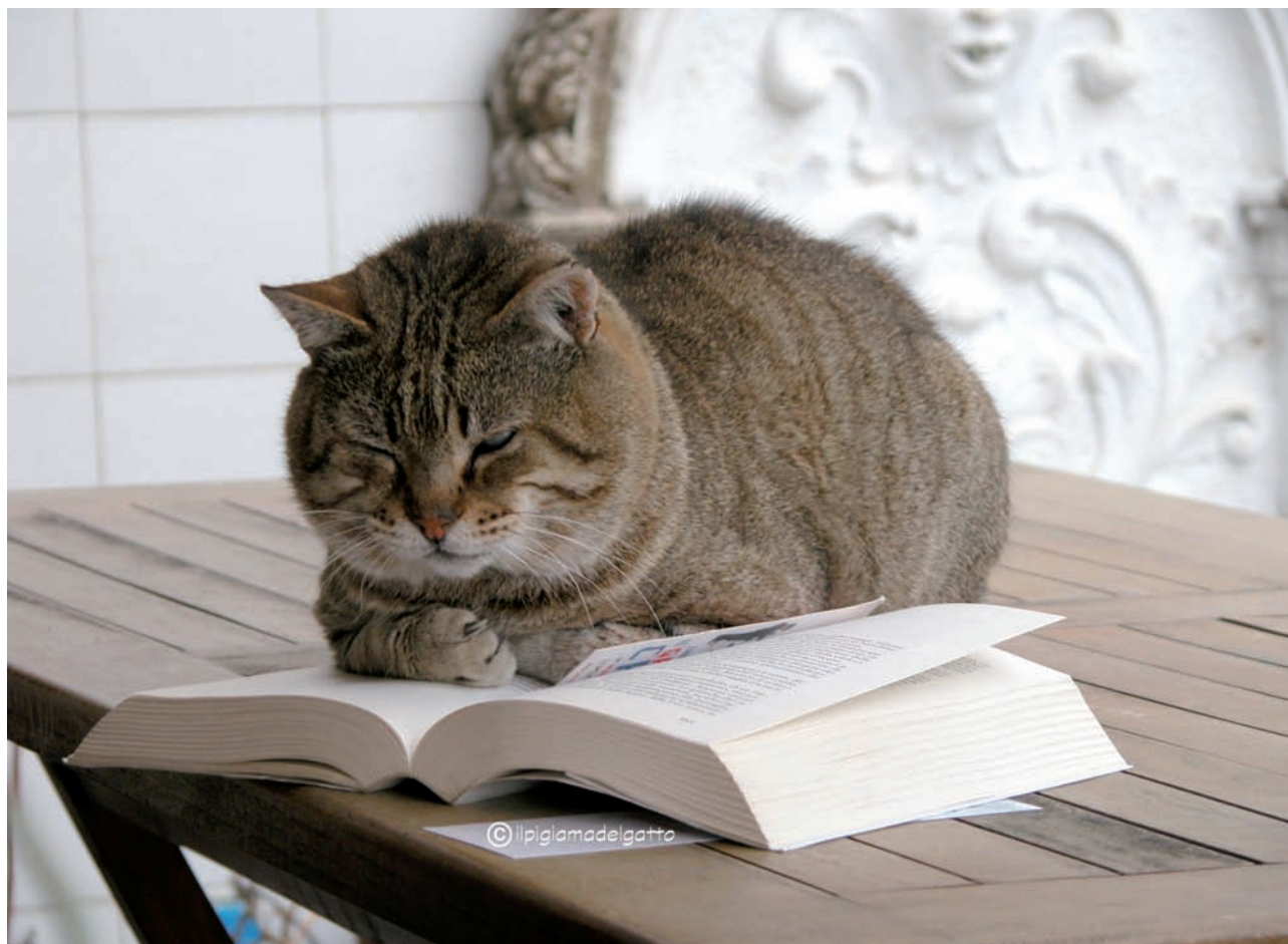
MURR, gatto lettore