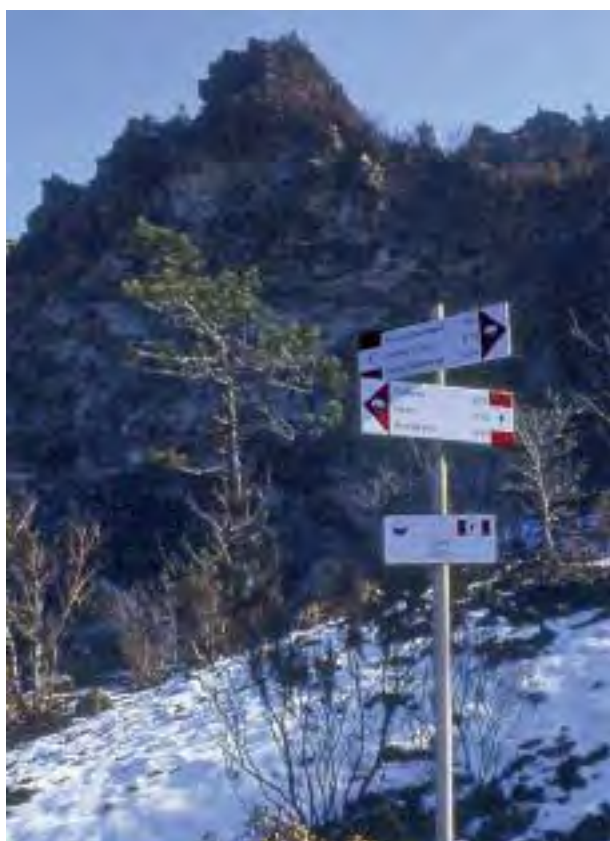
Segnaletica verticale alla Cava principale