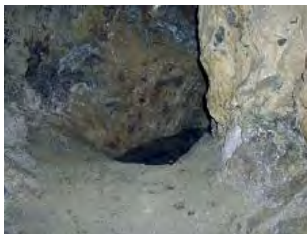
Il piccolo pozzo con laghetto, al termine della galleria di mina