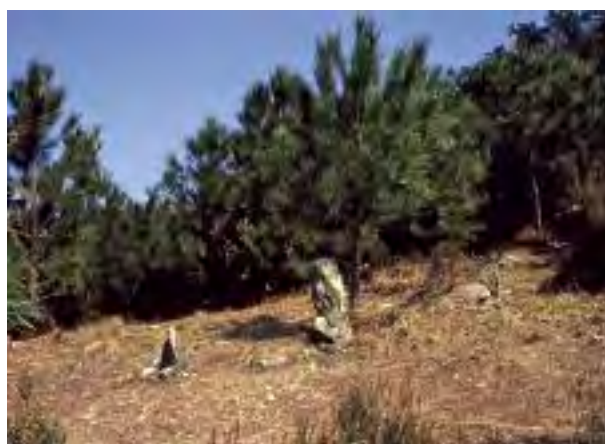
I cippi di confine alla Colétta di Tèrmi 425 m.