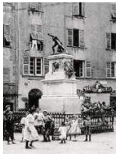
La statua del Balilla ai primi del '900