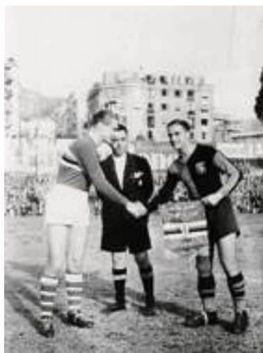
Il primo derby Genoa-Samp nel '46