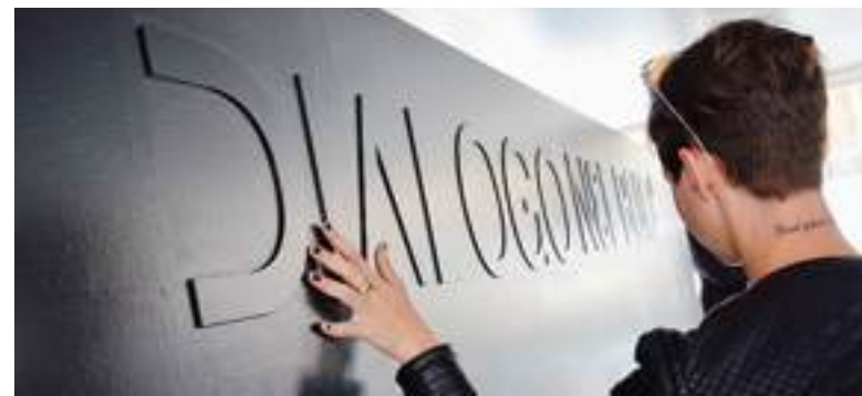
Una delle visitatrici del laboratorio "Dialogo nel buio" FORNETTI

Nella chiatta dove aveva sede l'Urban Lab, oggi al Matitone, si è quindi trasferito questo vero e proprio percorso didattico - tanto che lo spon-